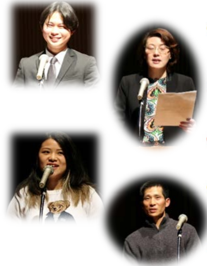
↑ các thuyết trình viên lần trước

Là lễ hội giao lưu người Nhật và người nước ngoài. Các bạn nước ngoài sống tại Yokohama sẽ thuyết trình bằng tiếng Nhật. Chúng tôi mong chờ người chưa từng đến Nhật, người đã sống ở Nhật rất lâu, người muốn biết thêm về Nhật và cả người muốn kể về đất nước của mình Dù bạn không nói được tiếng Nhật hoặc không nghe được tiếng Nhật thì cũng không sao vì chúng tôi có nhân viên người nước ngoài và các tình nguyện viên dạy tiếng Nhật! Chúng tôi sẽ vạch ra kế hoạch sao cho mọi người đều tham gia vui vẻ cùng nhau . Nhất định đến dự nhé!