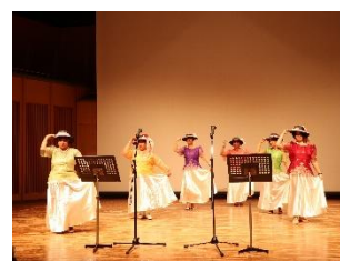
↑ В прошлые годы так проходили мероприятия