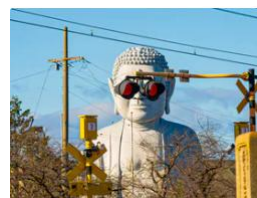
日本の「サングラス大仏」が話題に