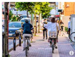
日本、歩道走行の自転車に罰金の可能性？